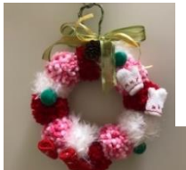
〈スタッフ小澤さん作成〉